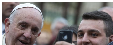
Il Papa: è normale che i bambini piangano, mai cacciarli dalle chiese - Politica