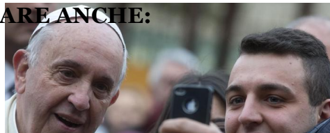
Il Papa: è normale che i bambini piangano, mai cacciarli dalle chiese - Politica