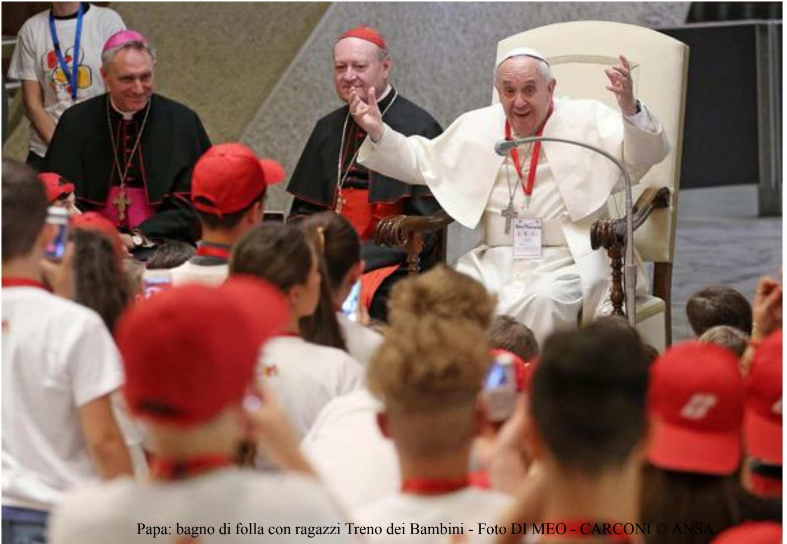
Papa: bagno di folla con ragazzi Treno dei Bambini

Accoglienza speciale per Papa Francesco questa mattina da parte dei circa 200 ragazzi giunti in Vaticano con il Treno dei Bambini. Papa Francesco è arrivato accompagnato in auto a mezzogiorno davanti l'Aula Nervi dove sta per tenere loro un discorso, accolto da un gruppo dei bambini del treno che lo hanno salutato facendo librare nel piazzale tanti aquiloni in volo, un gesto che simboleggia il tema scelto quest'anno dal Cortile dei Bambini, quello del "volo" perché - è stato spiegato - vuole offrire ai più piccoli che vivono con le loro madri una quotidianità fatta di carcere e allontanamento dagli altri fratelli, e a quelli che vivono la separazione della loro mamma detenuta, una giornata per volare via ed evadere con la fantasia dalla realtà con cui sono costretti a fare i conti.