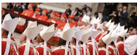
Papa: 'Ecco le 15 malattie della Curia' - Politica