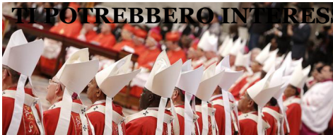
Papa: 'Ecco le 15 malattie della Curia' - Politica